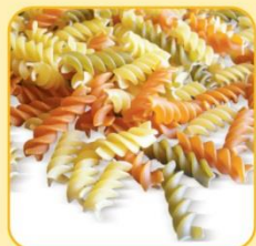
Паста Фусили Трицветни