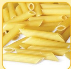
Паста Пене Ригате